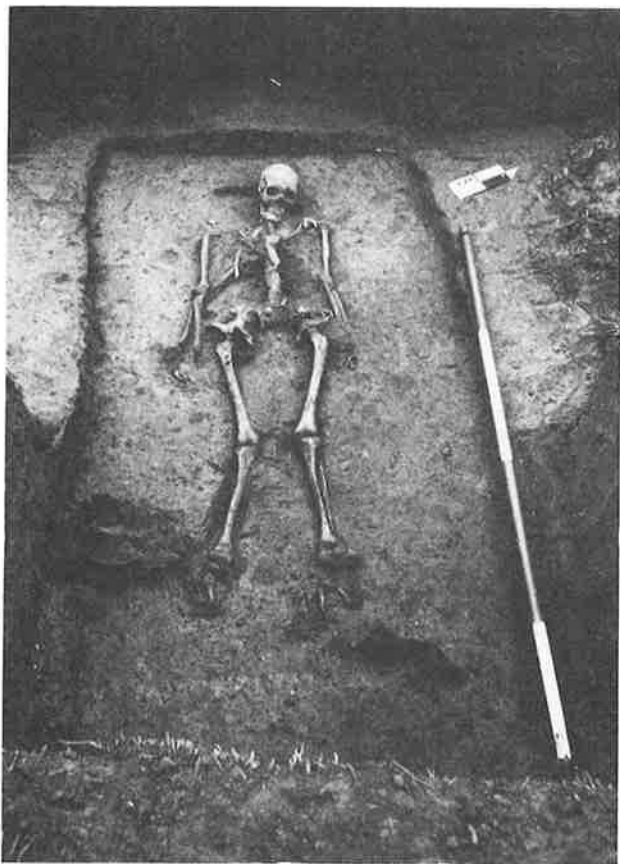
Cimetière mérovingien d'Orp-le-Grand, tombe.