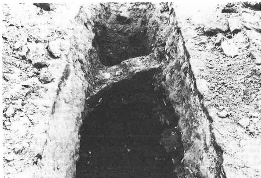
Sleuf in de Verdedigingsstraat te Gent met vermoedelijk overblijfselen van een waterput.