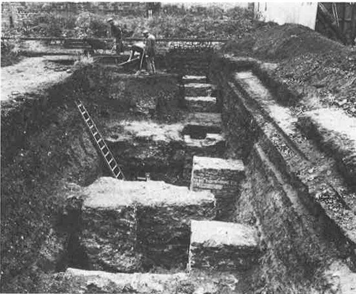
Gezicht op een rij natuurstenen pijlers in de buitentuin van de Sint-Pietersabdij te Gent (foto ROL, Gent).