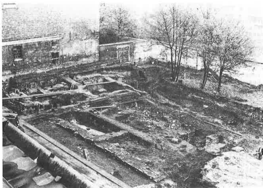
Gezicht op de buitentuin van de Sint-Pietersabdij.